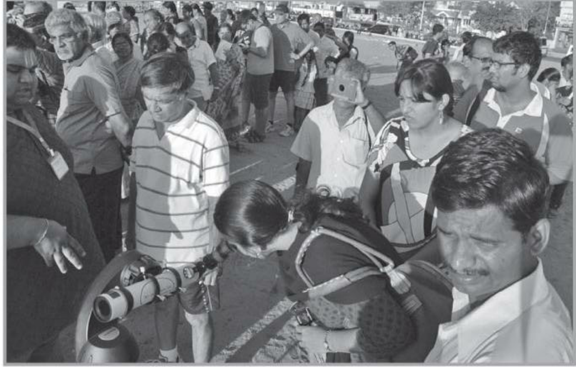
பெசன்ட்நகர் எலியட்ஸ் கடற்கரையில் விண்வெளி அதிசயத்தை டெலஸ்கோப்பில் பார்க்க கியூவில் ஆர்வத்துடன் நின்ற பொதுமக்கள்.