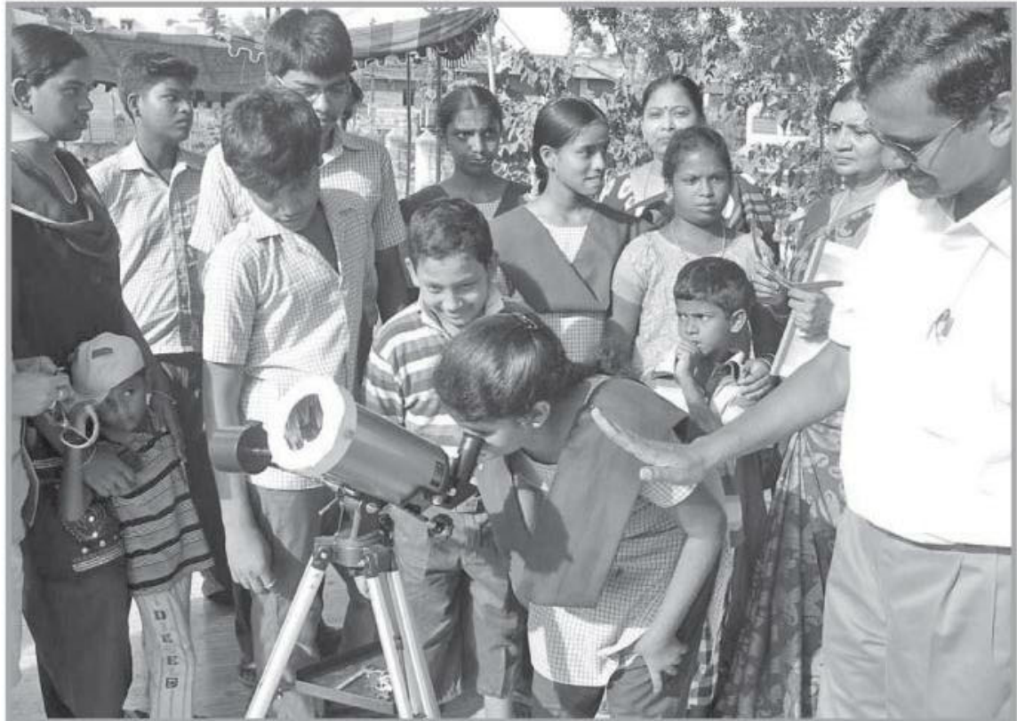
தாம்பரத்தில் டெலஸ்கோப்பில் சூரியனை வெள்ளி கடக்கும் நிகழ்ச்சியை பார்க்கும் மாணவ- மாணவிகள்.